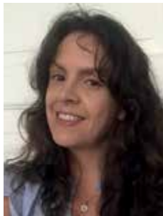
Af Iben Bjurner

I Civita D'Antino sydøst for Rom skal et nyt kulturhus for nordiske kunstnere og studerende åbne i et af byens gamle palazzoer. Projektet drives af et medlem af adelslægten Ferrante, som har tilbagekøbt huset, der tidligere var i familiens eje.