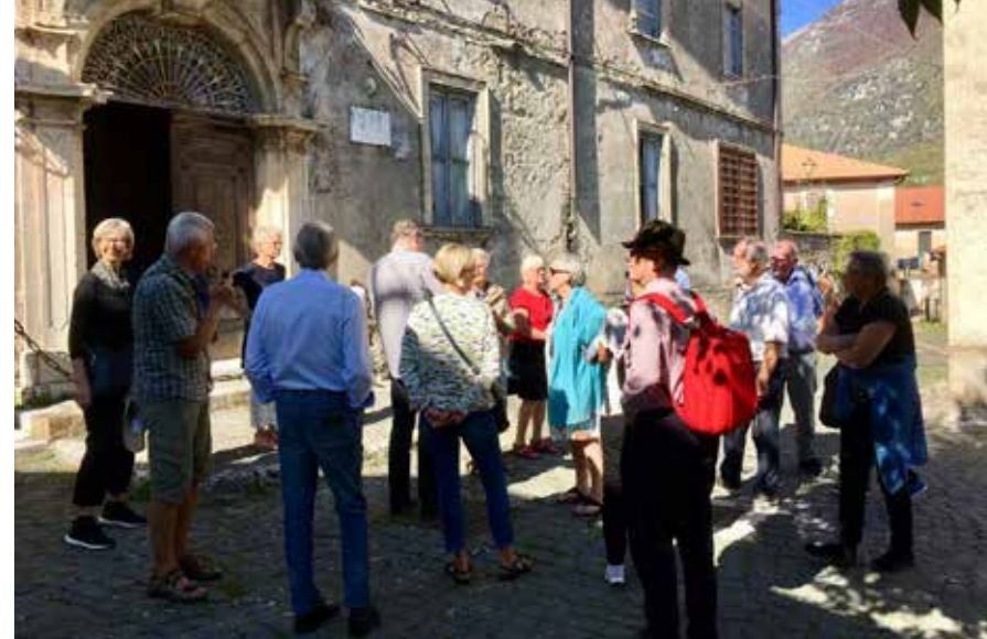
Dansk gruppe på besøg i Civita D'Antino med Palazzo Ferrante i baggrunden.

Kristian Zahrtmann (1843-1917) vandrede nemlig selv omkring nær palazzoet sammen med notabiliteter som P.S. Krøyer (1851-1909) og mange andre nordiske kunstnere i slutningen af 1800-tallet. Her fik de øje på byen i 904 meters højde med det helt særlige lys, som de lod skinne på deres lærreder og i dansk kunsthistorie.