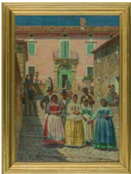
Bryllupsselskab i Abruzzo, Kristian Zahrtmann.

På verdens tinde i den lille bjergby Civita D'Antino omkring 130 kmsydøst for Rom ligger Palazzo Ferrante, som efter århundreders leben nu slumrer tavst med udslukte øjne. Palazzoet var engang den majestætiske højborg for den adelige, italienske Ferrante-slægt - en af de fremtrædende familier i området. Tidens tand har dog for længst taget en bid af 1600-tals-huset, og facaden har mistet gløden i kinderne. Den var oprindeligt sarte lysere, som Kristian Zahrtmanns maleri, Bryllupsselskab i Abruzzo fra 1896, afslører.