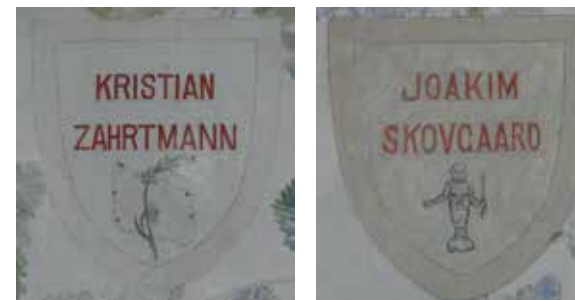
Zahrtmanns og Skovgaards våbenskjolde i Casa Cerroni.

Udenfor er alt dog sit gamle, italienske jeg, og sceneriet er stadig lige så betagende som i Zahrtmanns og Krøyers dage. Små, bugtede gader og stræder, ældgamle vagttårne, skønne udsigtspunkter og huset Casa Cerroni, hvor de danske kunstnere boede og efterlod sig smukke vægmalerier, blandt andet i form af våbenskjolde med deres navne.