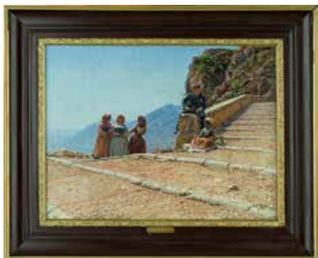
Trappen i Civita D'Antino, Kristian Zahrtmann

Oprindeligt var byen et slags stort, kreativt "kontorfællesskab" for de mange kunstnere, som fulgte i hælene på Kristian Zahrtmann og P.S. Krøyer fra 1880'erne og frem. I den lille, pittoreske by, som står på tå i en evig balance højt oppe på en Abruzzerbjergenes skråninger, boede en større koloni af kreative hjerner midt i områdets storslåede scenerier. Om Civita D'Antino sagde Kristian Zahrtmann: "Om morgenen er her vidunderlig dejligt. Skyerne ligger under én som et stort, stivnet ishav, og kun enkelte toppe rager op som øer."