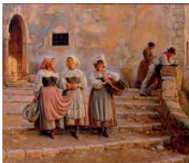
Unge kvinder der bærer lime, Kristian Zahrtmann

Kristian Zahrtmann selv blev udnævnt til æresborger i Civita D'Antino i 1902, og den dag i dag kan man se beviset på denne hædersbevisning på plaketten, der er skrevet på dansk og hænger ved byporten Porta Flora. Det var netop foran denne port, at en flok unge, italienske fruer i 1883 var på vej ned ad trappen på et af kunstnerens ikoniske malerier.