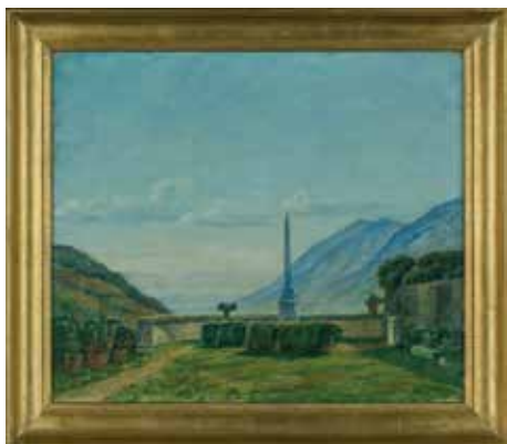
Giardino Ferrante, Johan Rohde

Accademia delle Belle Arti - Roms kunstakademi - og de nordiske akademier i Rom har alle udtrykt gentagen interesse for restaureringsprojektet, fordi Palazzo Ferrante har stor kulturhistorisk værdi set i lyset af dets egen og Civita D'Antinos fortid.